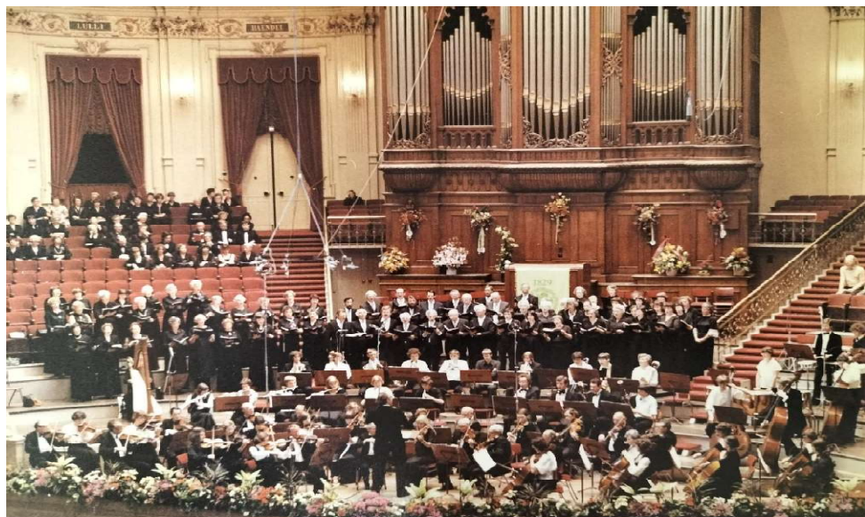
Toonkunst Wageningen in Concertgebouw Amsterdam ter gelegenheid van 150 jaar Maatschappij tot Bevordering der Toonkunst op 25 en 26 mei 1979. Grote Zaal Concert Gebouw Amsterdam