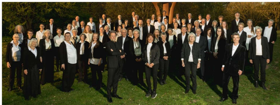
Toonkunstkoor Wageningen anno 2026

Bent u geïnteresseerd in de Wageningse muziekgeschiedenis en in het wel en wee van Toonkunstkoor Wageningen in het bijzonder, let dan op de aankondiging van ons najaarsconcert 2026. Vermoedelijk komt van het Jubileumboekje ook een digitale versie, die in dat geval via onze website https://toonkunst-wageningen.nl/ kan worden gedownload.